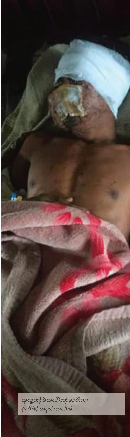
အူထွထုပ်ဖဲအယီဘုန်မှပိလါ ခိုကီစဲအပူဝဲအလီခဲ.