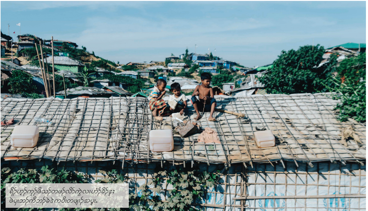
ရိပ်ဟွန်ကျွန်ဖိတဖန်လိာ်ကွလၢဟံၣ်ခိၣ်ဒုး ဖဲပုၤဘၣ်ကီၤဘၣ်ခဲဒဲကဝီၤတဖျါၣ်အပူၤ.

ဒ်န့ၣ်တဖၣ်လီၤ.အဝဲသ့ၣ်သ့ၣ်ညါလၢမ့ၢ်ပုၤလၢအဆံးလီၤ.-ဘၣ်ဆၣ်သန့ကတၢ်အဲၣ်အတၢ်ဖံးတၢ်မၤအဆံးဖိတဖၣ်.တၢ်မ့ၢ်လၢအတၢ်ကွၢ်တဖျါးတဖၣ်.တၢ်သ့ၣ်ညါလၢအဝဲသ့ၣ်ပုၤတသးပုၤနီၣ်အိၣ်ဒီးယွၤအတၢ်တီၢ်အိၣ်လၢအဝဲသ့ၣ်အဂီၢ်အံၤမ့ၢ်တၢ်လၢအရၢလီၤတၢ်ဟူးတၢ်ဂဲၤတမံၤအံၤလီၤ.