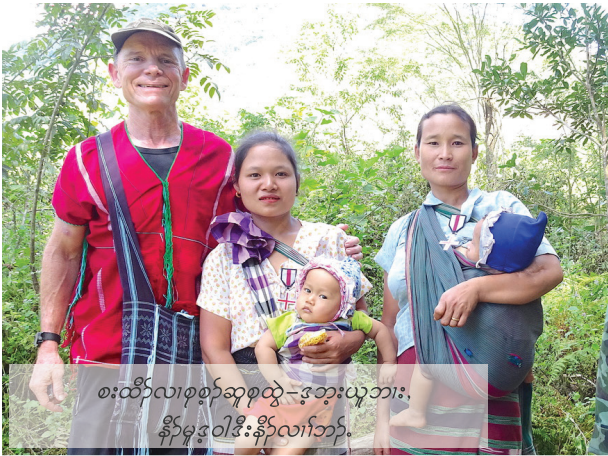
စးထီၣ်လၢစုစုဆူထွဲ-ဒုဘူးယူဘား၊ နီၣ်မုၢ်ဒုဝါဒီးနီၣ်လၢကံၤဘၣ်.