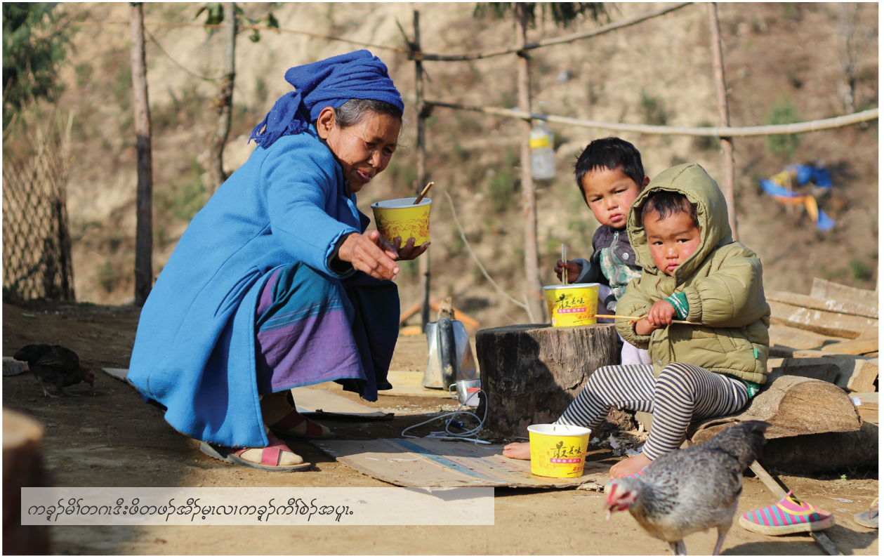
ကခုန်မိတ်တကဒီးဖိတဖှ်အိဉ်မုလကကခုန်ကီဉ်စဉ်အပူ။