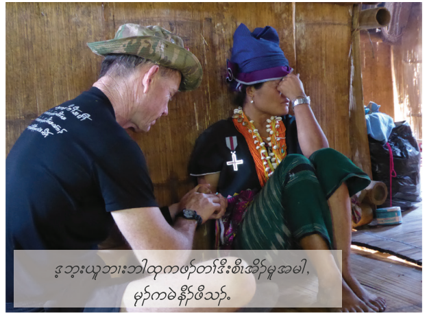
ဒုဘူးယူဘားဘၢထုကဖၣ်တၢ်ဒီးစီးအိၣ်မူအမါ၊ မုၢ်ကမဲနီၣ်ဖီသ့ၣ်.