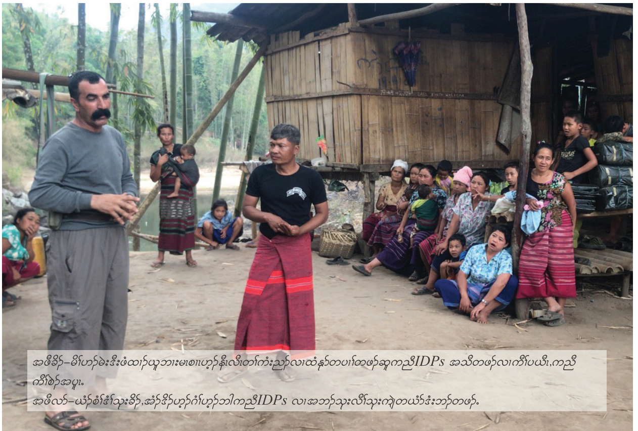
အဖီခိင်-မိဟ်ဟ်ခဲးဒီးဖိထက်ယုဘားမၤစၢၤဟ့ၣ်န့ၤလီၤတၢ်ကံးညှာ်လၢထံန့ၣ်တပၢ်တဖၣ်ဆူကညိIDPs အသိတဖၣ်လၢကီၢ်ပယီၤကညိ ကီၢ်စံာ်အပူၤ. အဖီလၢ-ယံာ်စံာ်ဒ်းသုးခိၣ်,အံၣ်ခိၣ်ဟ့ၣ်ဂံၢ်ဟ့ၣ်ဘိကညိIDPs လၢအဘၣ်သုးလီၤသုးကျဲတယံာ်ဒီးဘၣ်တဖၣ်.