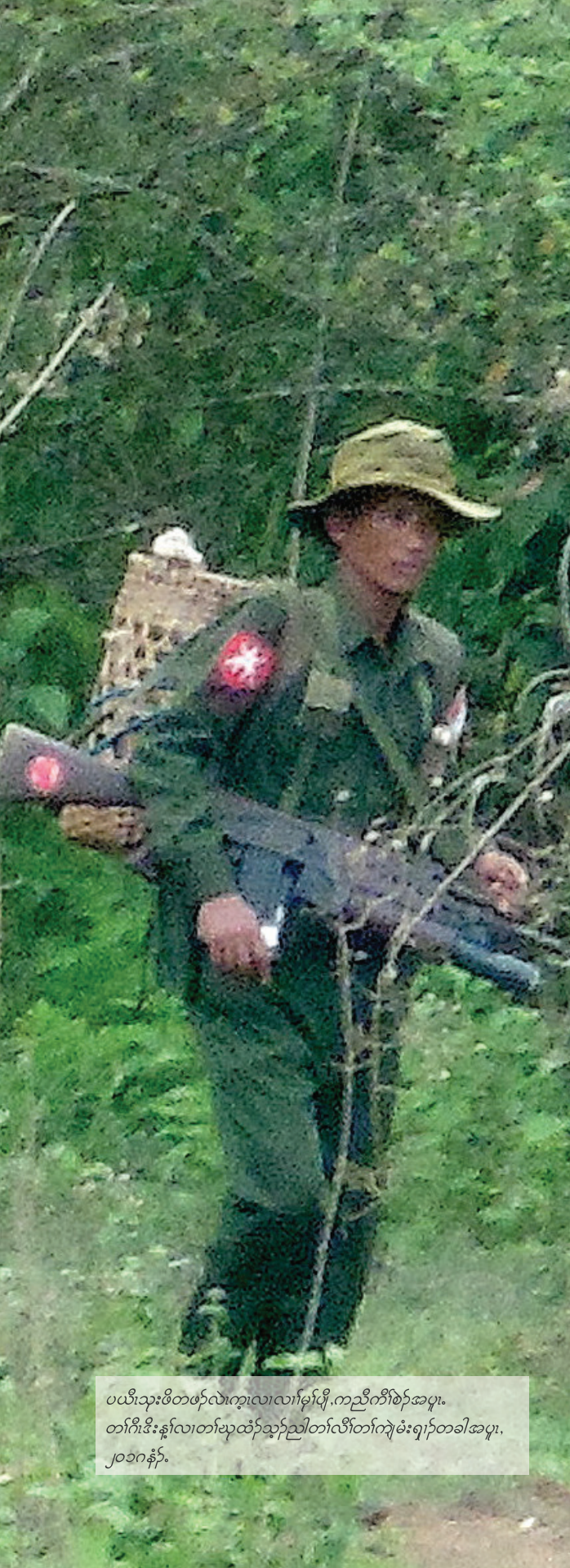
ပယိုးသုးဖိတဖ်လဲကွဲလဲလားမုာ်ဖျိ,ကညီကီာ်ဖဲာ်အပူ, တာ်ဂီဒီးန့ာ်လဲတဲာ်ယုထံာ်ညါတာ်လီာ်ကဲာ်မံးရှာ်တခါအပူ, ၂၀၁၈နံာ်.