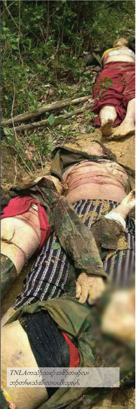
TNLAကသံၣ်သရၣ်အစိာ်တဖၣ်လၢ ဘၣ်တၢ်မၤသံအိၤလၢပယိသုးမုၢ်.

ကခွၢ်တၢ်သဘျီသုးမုၢ်အတၢ်ဟ်ဖျါထီၣ်အပူၤ,ဖဲလၢယုလံသံ န့ၣ်ပယိသုးမုၢ်,မၤဆါပယု,ဒီးမၤသံ (TNLA) ကသံၣ်သရၣ် မုၢ်ယုဂၤလိာ်.ပယိအသုးမုၢ်ခးဆူၣ်သိလုၣ်လၢအဟဲစိာ်ပုၤသ့ၣ် တဖၣ်အံၤဒီးမၤသံဝဲစ့ၢ်ကီးTNLA သုးဖိတဂၤဖဲတၢ်ဒုးတၢ်ယာ် အံၤစးထီၣ်အါလိာ်.TNLAသုးဖိအဂၤတဂၤဒီးပုၤပတီၢ်မုၢ်ခဲဂၤ ဟဲက့ၤပုၤဖျဲးသးလၢပယိသုးမုၢ်အတၢ်ဒုးတပျါတပျါသိလုၣ် ပဒးခဲဒိန်လၢအစိာ်ဆုၤတဖုအံၤလိာ်.