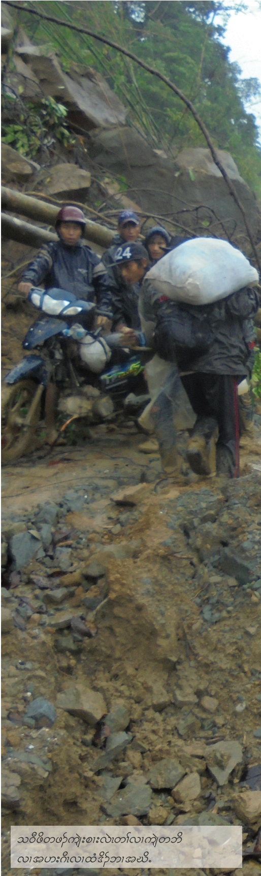
သဝီဖိတဖန်ကျေးစားလဲတော်လာကျဲတဘိ လာအဟးဂီလာထံဒိန်ဘာအယိ.