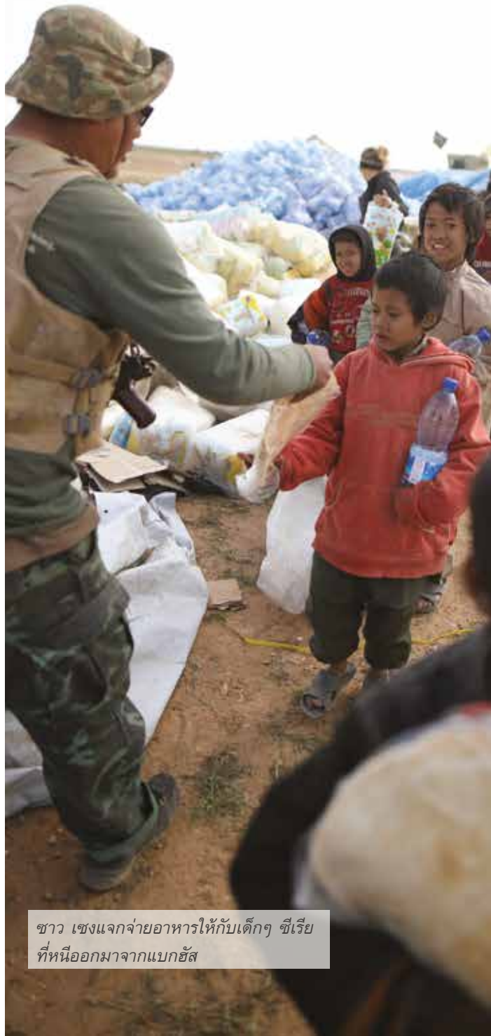
ชาว เซง แจกจ่ายอาหารให้กับเด็กๆ ซีเรีย ที่หนีออกมาจากแบกฮัส