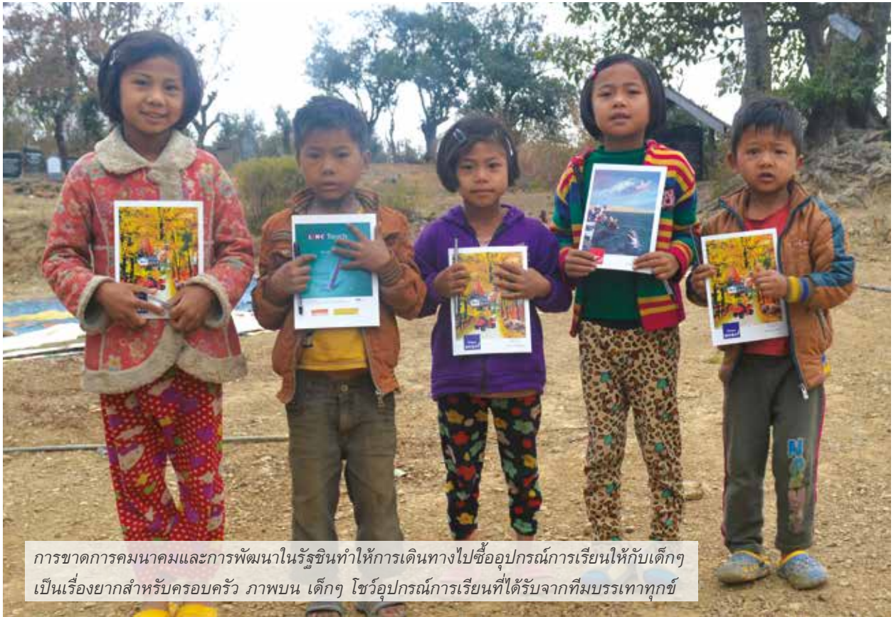
การขาดการคมนาคมและการพัฒนาในรัฐชินทำให้การเดินทางไปซื้ออุปกรณ์การเรียนให้กับเด็ก เป็นเรื่องยากสำหรับครอบครัว ภาพบน เด็กๆ โชว์อุปกรณ์การเรียนที่ได้รับจากทีมบรรเทาทุกข์