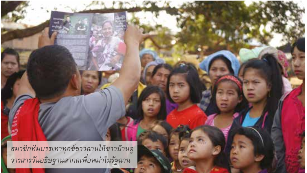
สมาชิกทีมบรรเทาทุกข์ชาวฉานให้ชาวบ้านดูวารสารวันอธิษฐานสากลเพื่อพม่าในรัฐฉาน

ภาคใต้ของรัฐฉานเป็นบ้านของหลากหลายชาติพันธุ์ทั้งชาวฉาน, ลาหู่, ปะโอและตะอาง (ดาระอั้ง) ที่นี้ปรากฏให้เห็นความขัดแย้งอย่างต่อเนื่องที่สุดมากกว่าส่วนใด ในพม่า แต่บ่อยครั้งเป็นความขัดแย้งระหว่างชาติพันธุ์กันเอง และมีความขัดแย้งระหว่างชาติพันธุ์กับกองทัพพม่าด้วยเช่นกัน