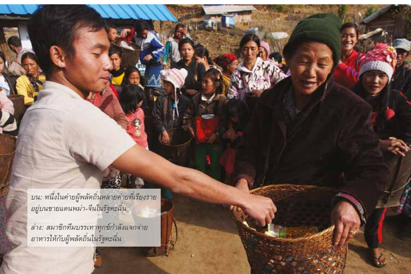
บน: หนึ่งในค่ายผู้พลัดถิ่นหลายค่ายที่เรียงราย อยู่บนชายแดนพม่า-จีนในรัฐคะฉิ่น ล่าง: สมาชิกทีมบรรเทาทุกข์กำลังแจกจ่าย อาหารให้กับผู้พลัดถิ่นในรัฐคะฉิ่น