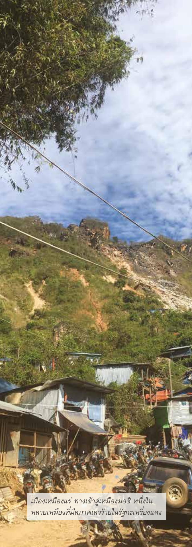
เมืองเหมืองแร่ ทางเข้าสู่เมืองมอซี หนึ่งในหลายเหมืองที่มีสภาพเลวร้ายในรัฐกะเหรี่ยงแดง